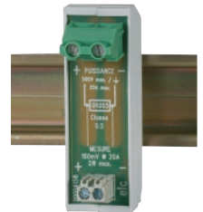
OPTION : SH10020* (Kaliber für 100mV) EAN : 3760244880635

2000 POINTS 3 Zifferen EINSTELLBARE Volt, Ampermeter