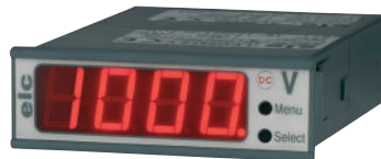
LED2472 Mit versorgung